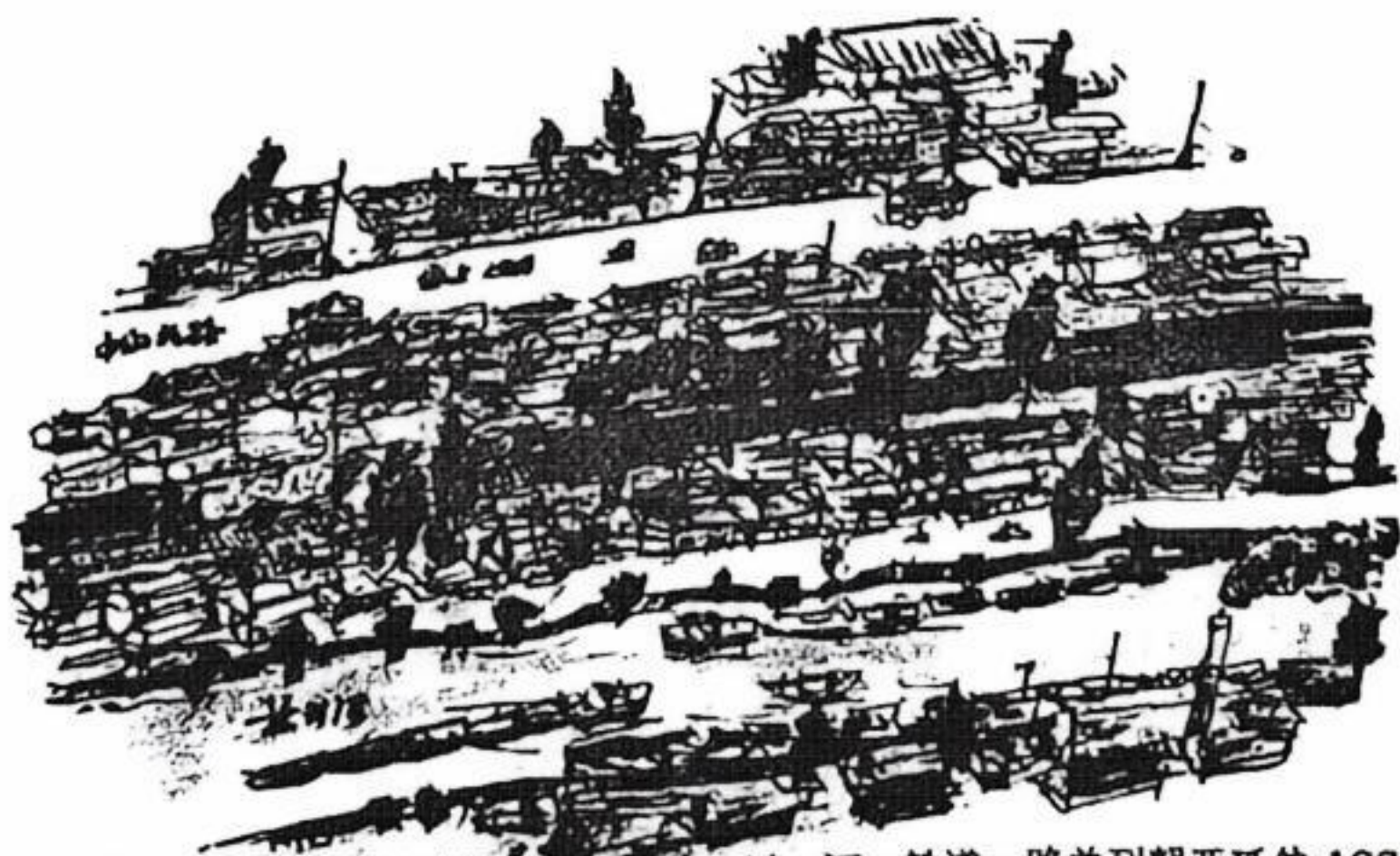
沪西苏州河紧靠沪杭铁路线与中山北路，以一河一铁道一路并列朝西延伸·1990

沿河这一带，船与火车互不相干，也憬然在目——岸上一旦地皮震动，就是火车临近的征兆了，船民木知木觉——舱板并不传递车轮震动，河床低陷，挡有混凝土防汛高墙，与铁路隔有低矮的民房、油毡棚户、杨树、丝瓜架、水塔、沙石抓斗，装粮食、垃圾的行车吊车，火车看不到船，船看不到路基上的火车，船家只听到声响，晓得有了变化——时常是等火车喧嚣奔腾，凶蛮逼近，几乎零距离，隔了棚户冲来，似乎撞毁堤墙，有闯入河中的错觉，船民毫不慌张，晓得自家船队与附近长长的快班货车，齐头并行，只一会工夫，也就远去。尤其是退潮时分，船家看不到黝黑的机头锅炉、红漆动力车轮、喷射阀门蒸汽的管道、司机面孔，车身也让棚户瓦垄、鸽子笼、晾挂衣被、裤袜、鳗鲞、草席、杨柳、梧桐、豆制品厂、中粮仓库砖墙遮挡。无风之日，船家手搭凉棚，望到一股直立烟柱由杂乱黑瓦、爬满野刺藤的山墙头上快速移过，上升、弥散、离开，就是火车的全部影像，假如司炉加大风量，黑烟更黑，带了粉煤屑的烟气飘撒到河面上、水葫芦上、船篷上、船尾破塘瓷痕盂里种的朝天椒上、行灶刚刚烧好的白粥上…… 不管船与火车并行、交会、背道而驰，永远不相为谋的态度，船队是永远平心静气，只接受慢风景，火车则一蓬烟，负心郎一样快捷离开，世界才有安宁。