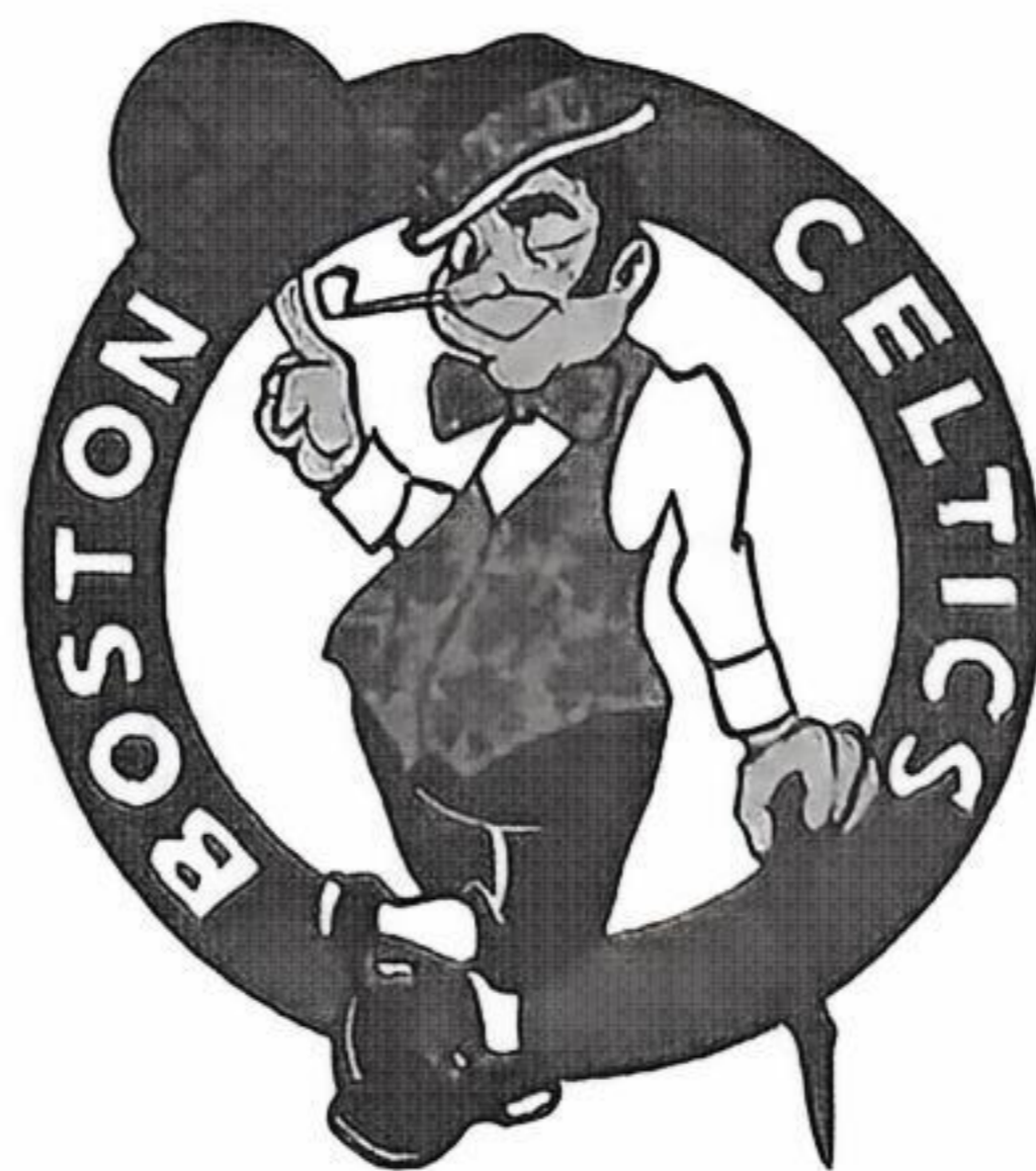
图 3 美国波士顿凯尔特人篮球队队标