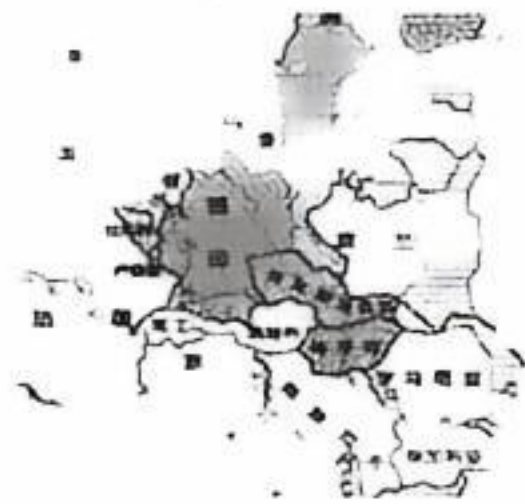
欧洲部分国家示意图

1919 年（在 19 世纪 40 年代）（法国）（和时）（并）以及捷克斯洛伐克（在波斯尼亚）（南斯拉夫）（一切欧洲国家）（条约）（结合图）（推想）去（因当时此举试图）