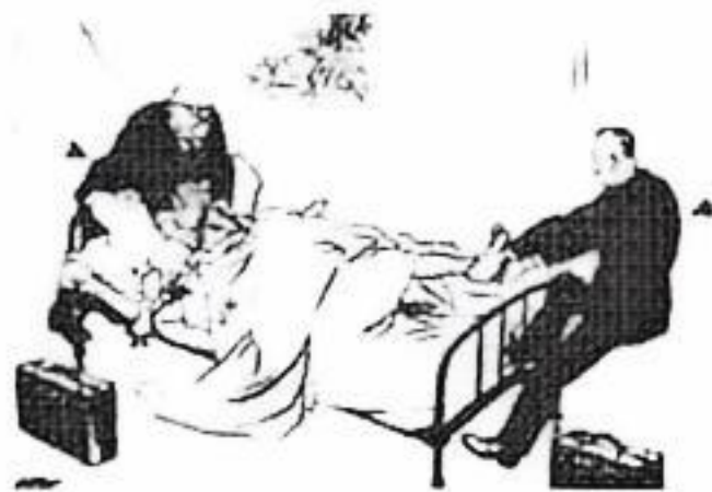
《上漫画创作》（40 年）（一）值联合国安理会（商讨）（不处理希腊内战问题）决议（至）