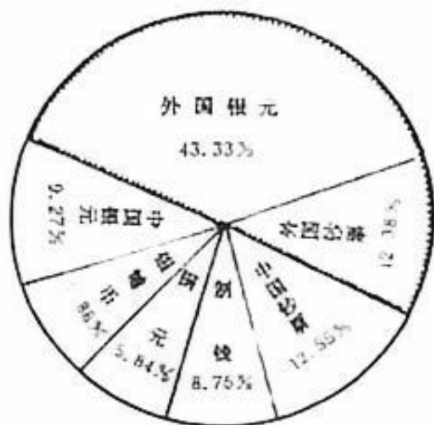
图 清末各种货币所占比例